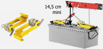
Lyftkrok för batteri