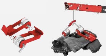
Lyftkrok för bromsok