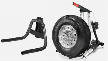
Lyftgaffel för hjul Ø från 60 till 120 cm 200 kg Max

Lyft nav- och skivenheterna direkt med kabeln och kroken.