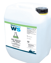
ref. 062511 kylmedel specialsvetsning - 5 l