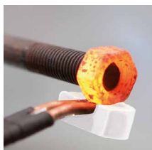
Lossar rostiga skruvar